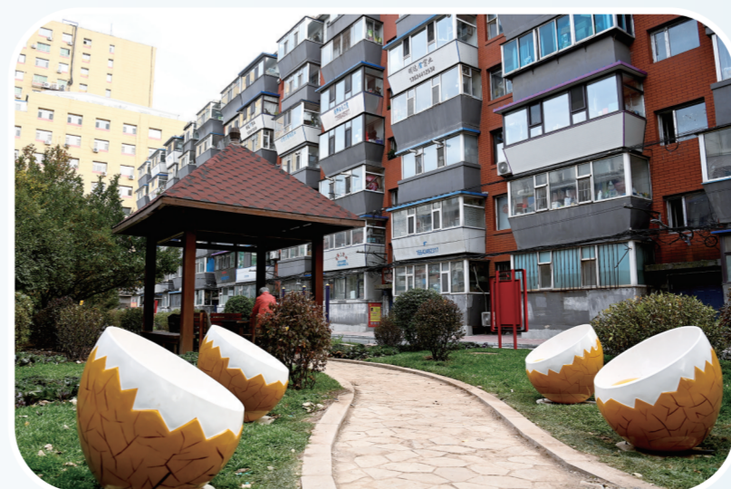
改造升级后的桂林路居民区。