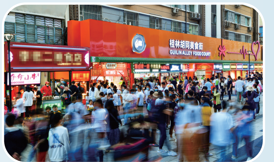
桂林路美食街吸引各地游客一探究竟。