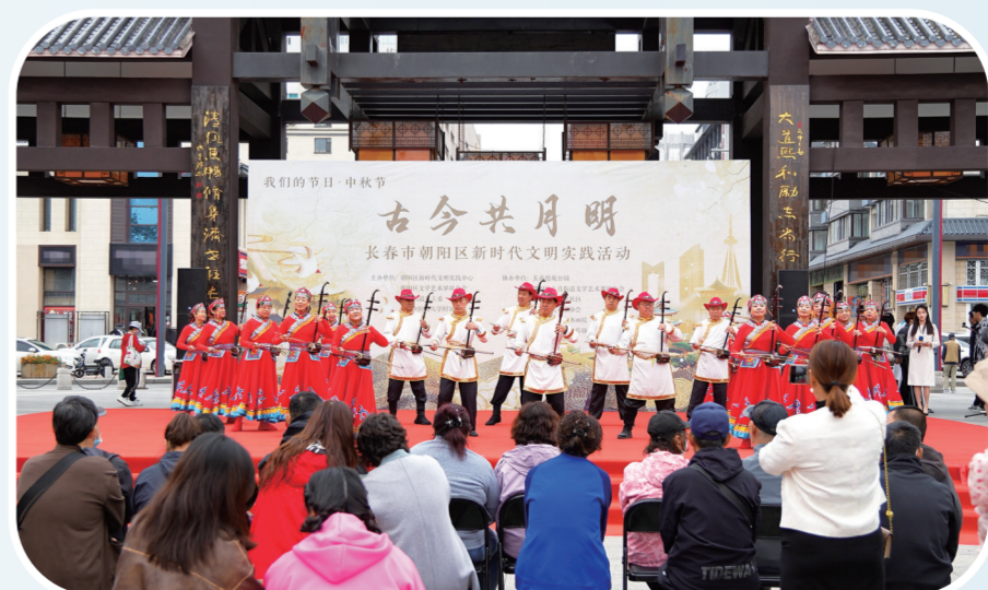
朝阳区商圈联盟组织了丰富多彩的活动。