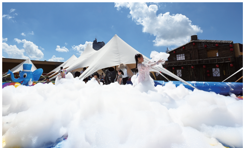
中泰海洋世界泡泡乐园。