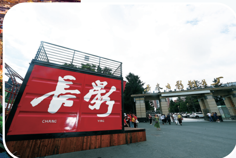
长影旧址博物馆是红旗商圈的“磁力点”。