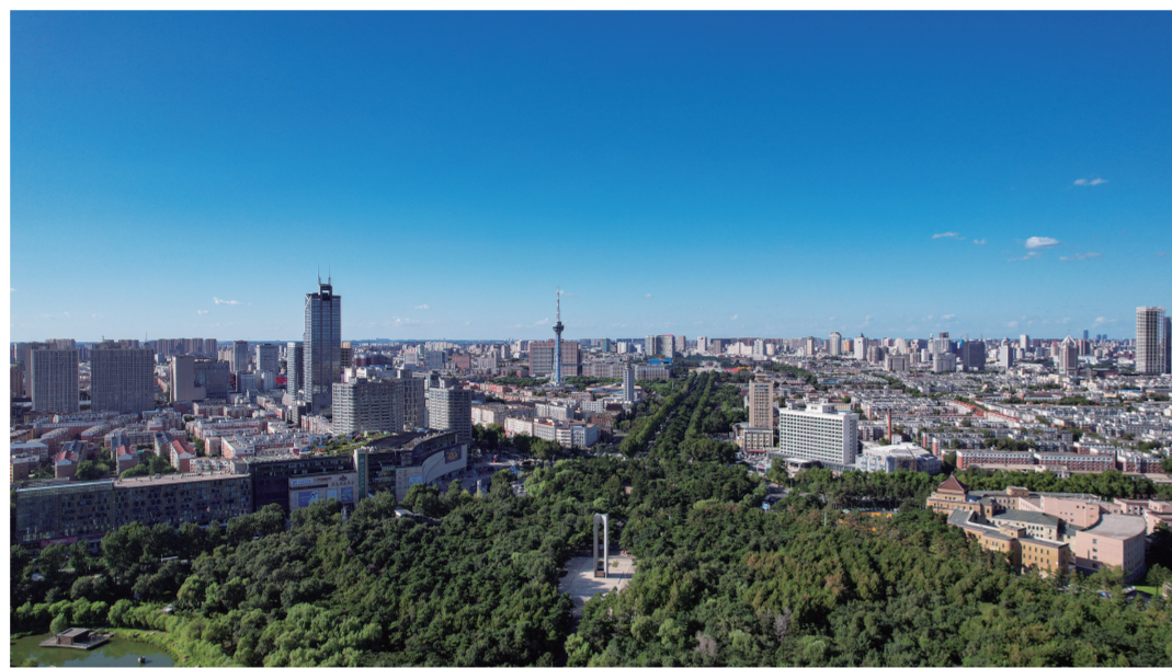
俯瞰朝阳区科技与文化的交汇之地。