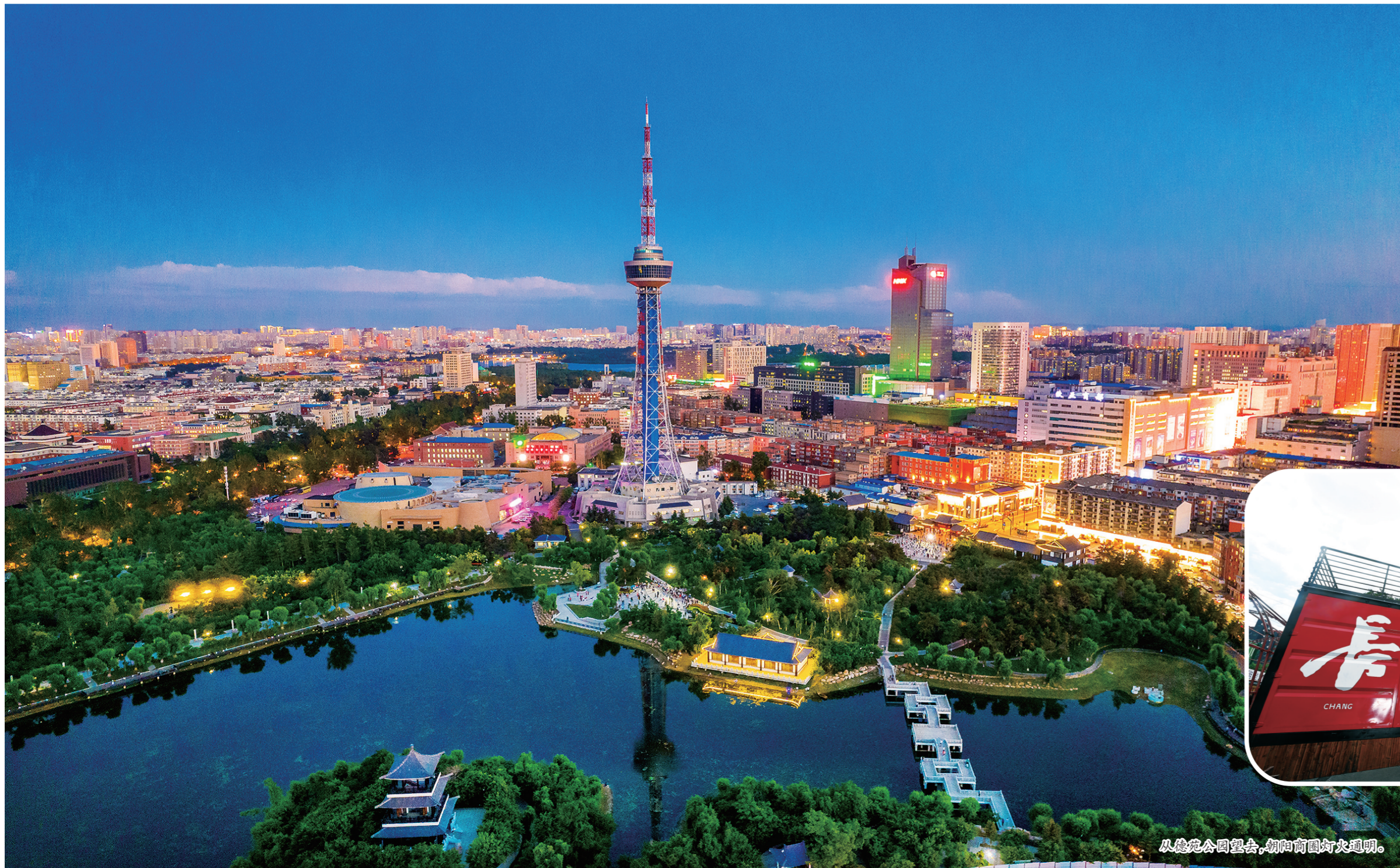
从鸟瞰图看，朝阳商圈灯火通明。