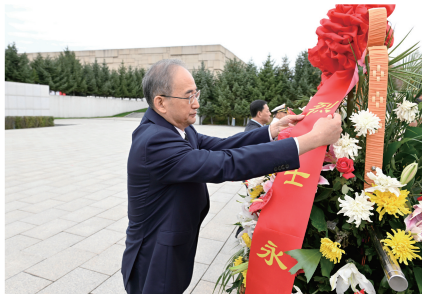
9月30日,省暨长春市向人民英雄敬献花篮仪式在长春市烈士陵园举行。省委书记黄强,省委副书记、省长胡玉亭,省政协主席朱国贤等缓步上前,神情庄重地在花篮前驻足凝视,仔细整理缎带,表达对革命英烈的崇高敬意。

本报9月30日讯(记者黄莺 邱国强)今年是中华人民共和国成立75周年。今年9月30日是全国第十一个“烈士纪念日”,省暨长春市向人民英雄敬献花篮仪式今天上午在长春市烈士陵园举行。省委书记黄强,省委副书记、省长胡玉亭,省政协主席朱国贤等我省党政军领导和老战士、老同志、烈士家属、社会各界干部群众代表一起,向烈士纪念碑敬献花篮,深切缅怀英烈功绩,大力弘扬革命精神,进一步凝聚奋进力量,推动吉林全面振兴取得新突破。 天地英雄气,千秋尚凛然。烈士陵园内松柏苍翠,烈士纪念碑巍然耸立,现场气氛庄严肃穆。10时许,敬献花篮仪式正式开始。礼兵迈着铿锵有力的步伐,行进到烈士纪念碑前伫立。伴随着雄壮的《义勇军进行曲》,全场齐唱国歌,旋律高亢激昂,歌声久久回荡。