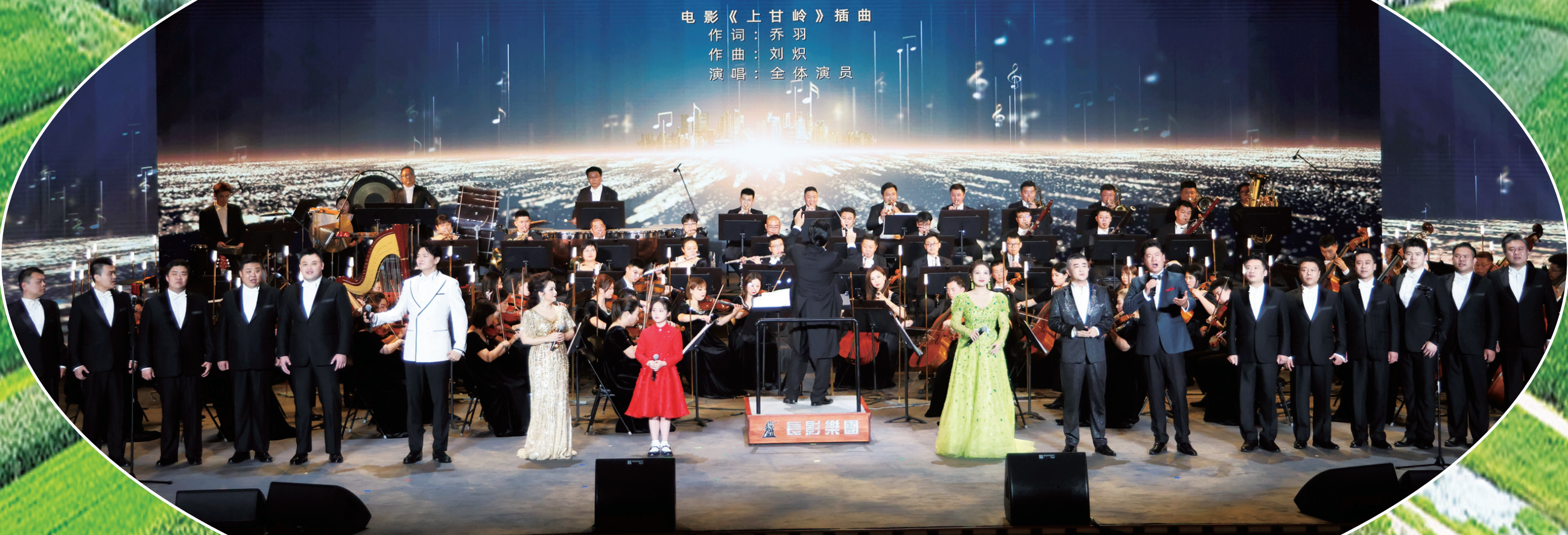
作为第十九届中国长春电影节主题文化活动之一,“2024光影之夜”晚会的音乐会将《我的祖国》这首经典歌曲搬上舞台,用悠扬的旋律感动观众,更用歌声向时代致敬,致敬那些默默奉献、燃烧生命的使命担当。