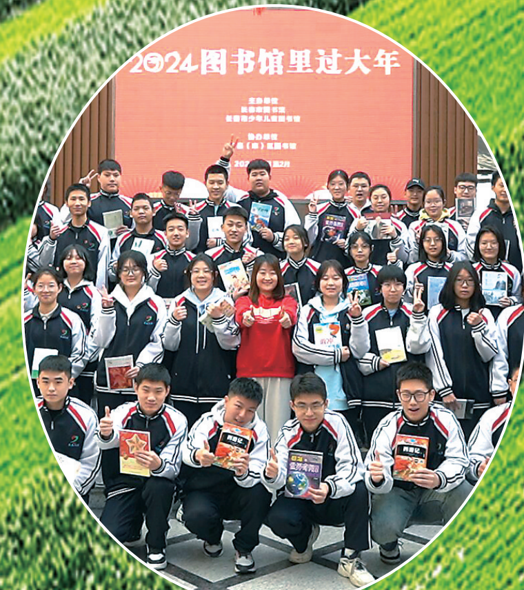
吉林省京剧院京剧团全体成员合影。 (资料图片)