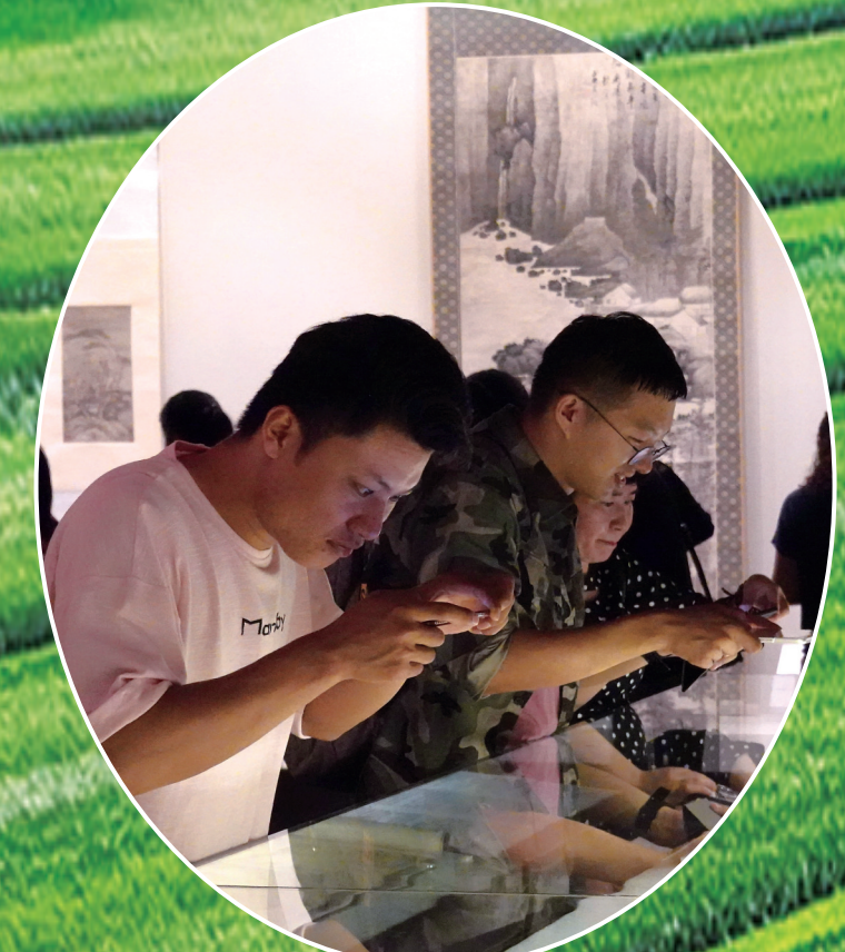
吉林博物馆彩色展览观众中儿童占多数。