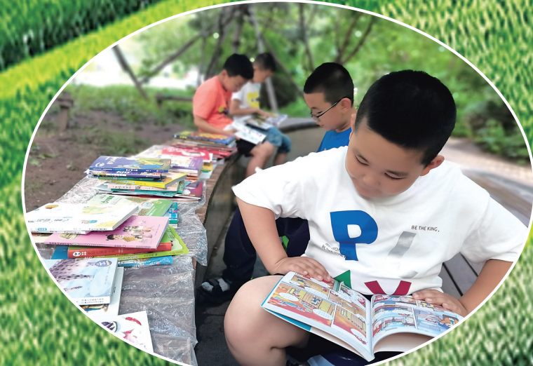
长春图书馆开展阅读推广活动。