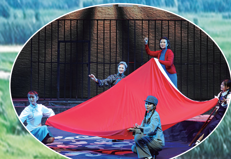
吉林(李一)剧院。