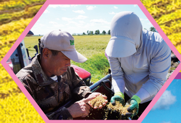
舒兰市的田间地头,到处都是农民们辛勤劳作的背影。

除此之外,舒兰市的牧草种植也喜获丰收,首批牧草成了当地1万羽白鹅的“盘中餐”。年初以来,为破解白鹅养殖成本高难题,舒兰市因地制宜在金马镇新胜利村发展温室牧草工厂化循环种植项目。走进新胜利村牧草工厂化循环种植项目温室大棚,立体式种植架一字排开,喷淋、光照、消毒等设施一应俱全,一株株绿油油的牧草长势喜人。这里的水培牧草种植系统采用自动化技术调节营养液浓度、光照强度等参数,确保牧草在最佳环境下生长。 “温室牧草种植后,一斤种子仅一周就可以转化为7斤鲜草。这种草可代替青饲料,富含丰富的维生素、蛋白质、氨基酸等,可以让白鹅的鹅绒更茂盛,节省养殖成本。”新胜利村党支部书记傅春说,他们日产牧草9吨至15吨,可为1.5万只成年鹅提供青储饲料,多余牧草将销售给养殖户,预计年底可为村集体增收40万元。