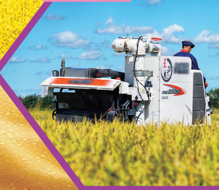
金秋九月,舒兰市收获季来临。