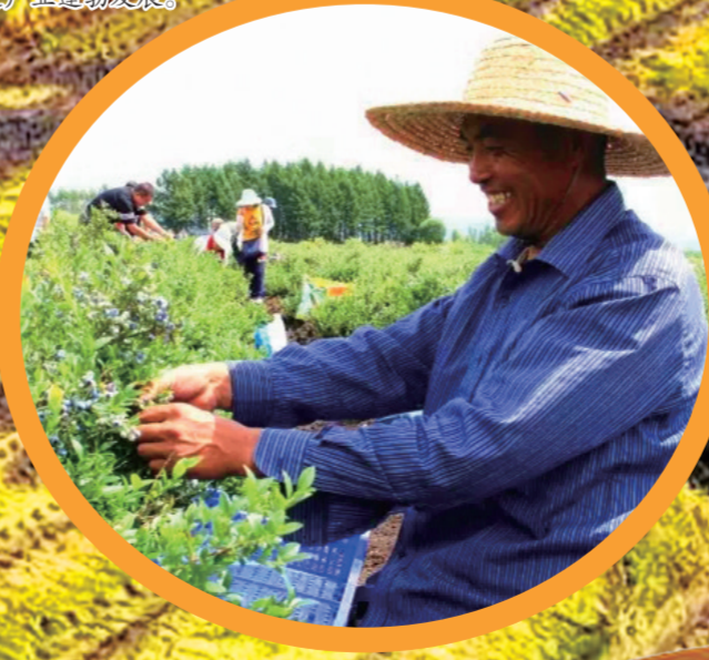
农民们正在田间忙碌,抢抓秋收的契机。