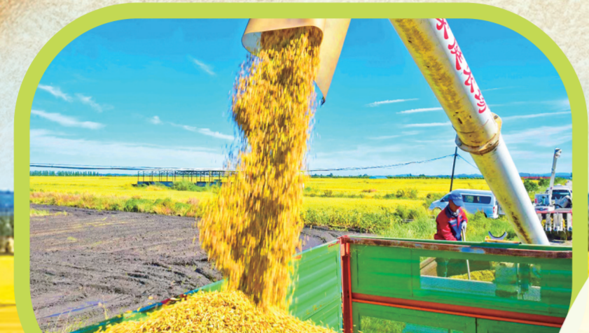
丰收的喜悦洒满江城大地。

预计“十一”期间,吉林市秋收工作将进入高峰期,11月初全市秋收工作有望基本完成。