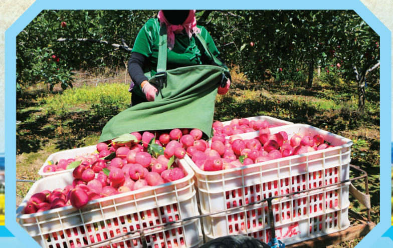
磐石市的“锦绣”海宴迎来丰收季。

在磐石市取柴河镇,黑木耳迎来了又一个丰收季。走进取柴河镇黑木耳种植基地,一排排整齐排列的菌棒上挂满了肥厚饱满、色泽黑亮的木耳,层层叠叠,长势喜人。工人们正忙着采摘、晾晒,一派繁忙丰收景象。 近年来,取柴河镇依托得天独厚的地理条件和优良的生态环境,大力培育、发展黑木耳种植产业,使小木耳成为农业增效、农民增收的“金耳朵”。 取柴河镇相关负责人告诉记者,因种植时间、气候不同,与春耳相比,秋耳的肉质更为厚实,口感更为滑嫩,销路也更好。今年,全镇共培育木耳菌袋100万袋左右,预计可产秋耳10万斤,年产量可达300万元。