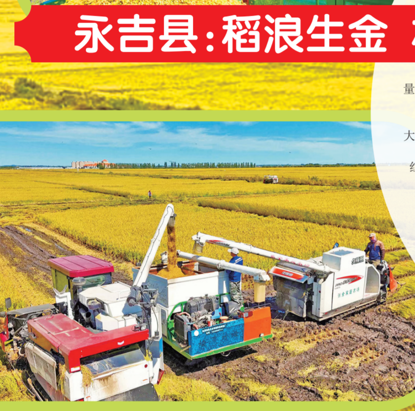
吉林市各粮食产地,水稻收割机正在加紧作业。