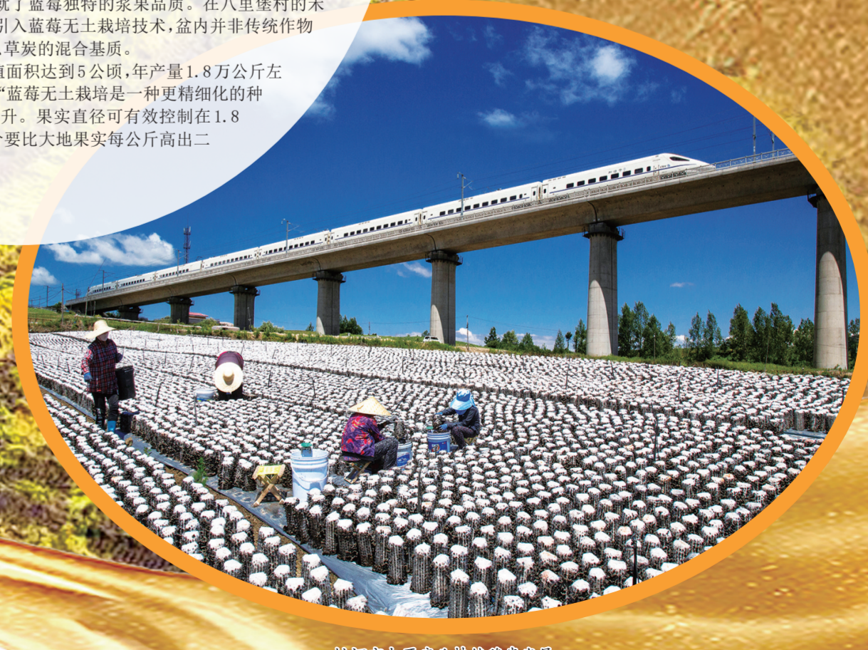
蛟河市木耳产业种植稳步发展。