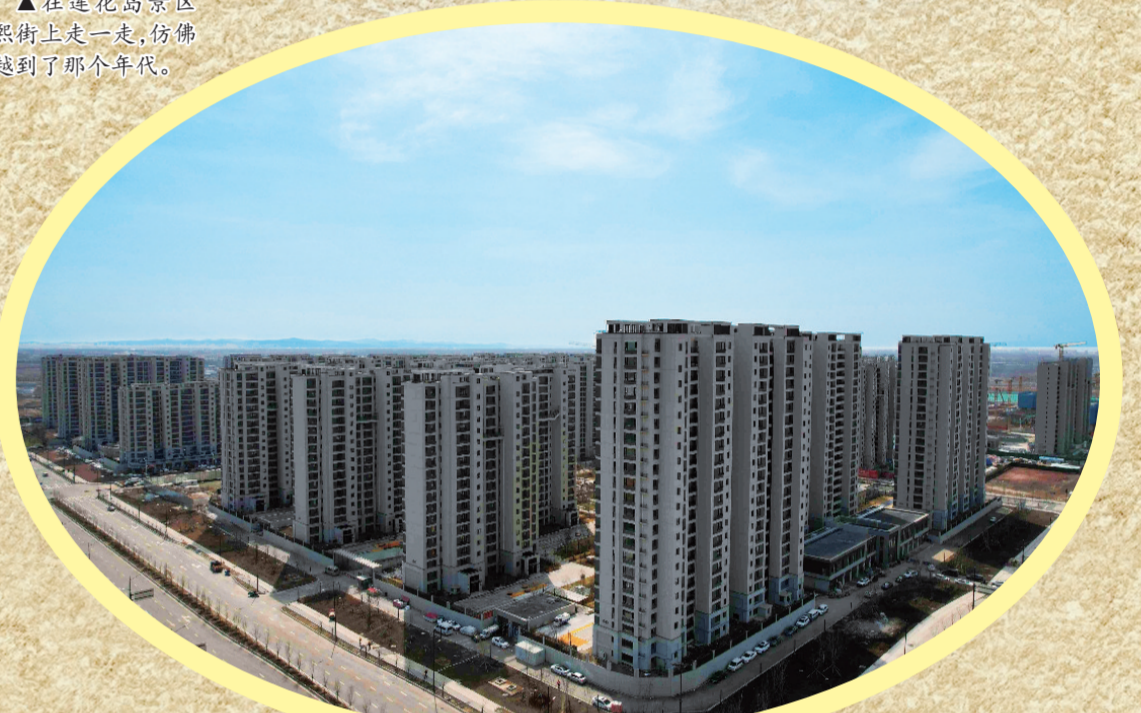
高楼林立,等你来驻。