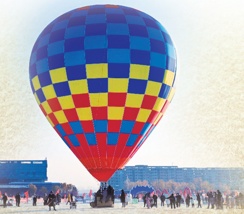
跟着热气球的视角,一起看看美丽的朝阳永春。