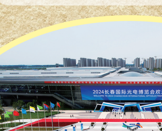
6月18日至20日,2024长春国际光电博览会在长春东北亚国际博览中心举办。

潮中,积极探索发展之路。当城市向南的蓝图谋定,棚膜经济的春风吹来,农丰村紧紧抓住这一机遇,开启了一场绿色的农业革命。