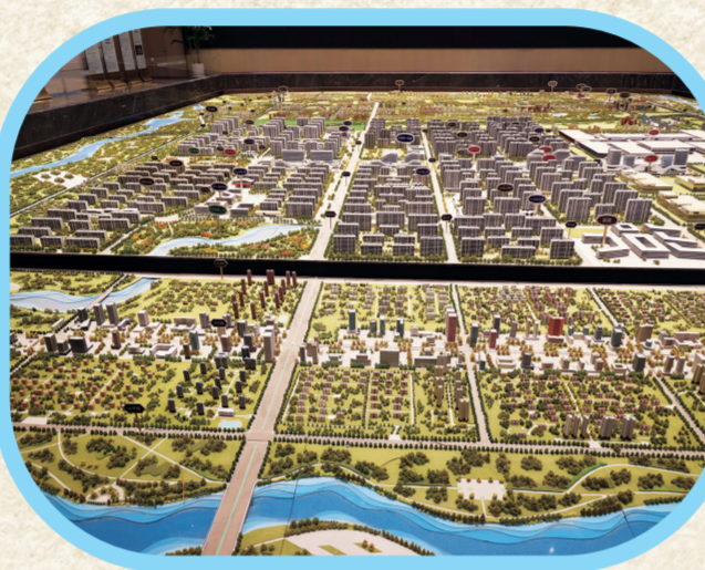
中铁长春博览城正在吸引各界关注的目光。

作为朝阳永春的先天之地,中铁长春博览城宛如一颗璀璨的启明星,以高起点、高标准、现代化的建设和多元化的功能,为这片区域注入了强大的动力。