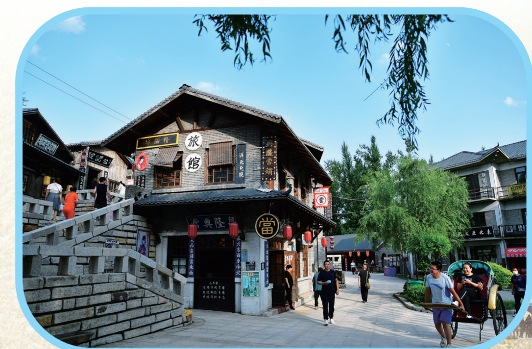
▲在莲花山景区洪照街上走一走,仿佛穿越到了那个年代。