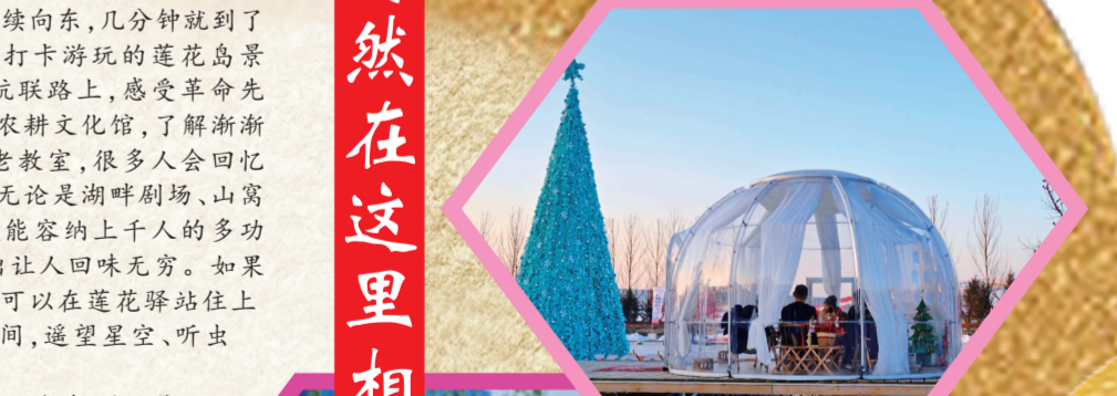
▲闲暇时不如到永春新乐园整个帐篷。

看着眼前的美景,不仅想到了范仲淹的《苏幕遮》——碧云天,黄叶地,秋色连波,波上寒烟翠。山映斜阳天接水,芳草无情,更在斜阳外。