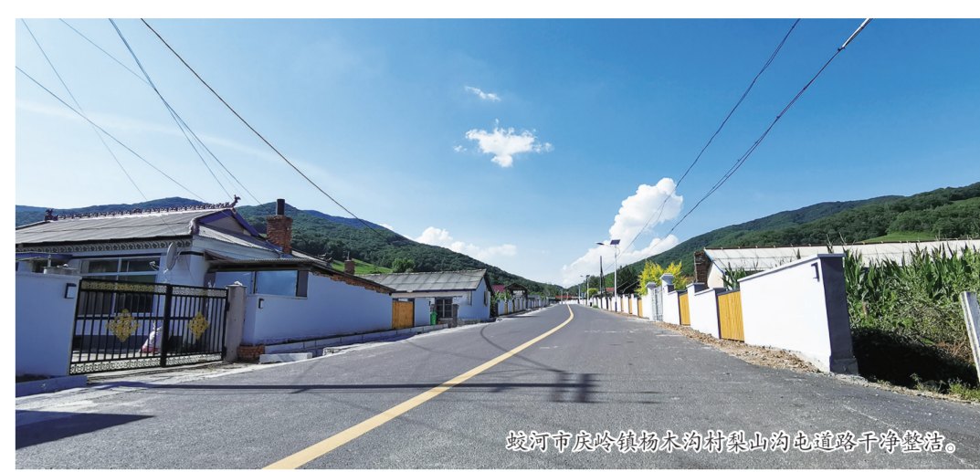
蛟河市长岭镇岭东村净美村庄建设成果展示。

同时，扎实开展示范村建设，启动2个省级“百村示范”村、22个“千村美丽”村、74个