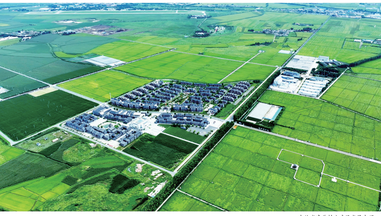
吉林市净美村庄建设成果丰硕。

截至目前，桦甸市清理农村生活垃圾2.97万吨、畜禽粪污等农业生产废弃物1.32万吨、村内沟渠3500公里、农村道路5624公里、淤积397.2吨，整治庭院4.5万户、公共场所4697处，动用各种车辆、机械11281台次。全市通过大喇叭、标语、宣传画、宣传单、人居环境整治知识讲座等多种方式，深入开展了系列净美村庄建设宣传活动，极大地调动了广大农民群众参与人居环境整治行动的积极性。