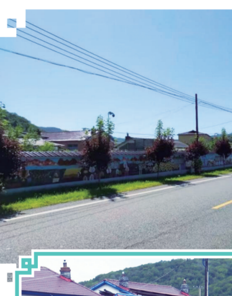
▲桦甸市公吉乡努力打造和美乡村。