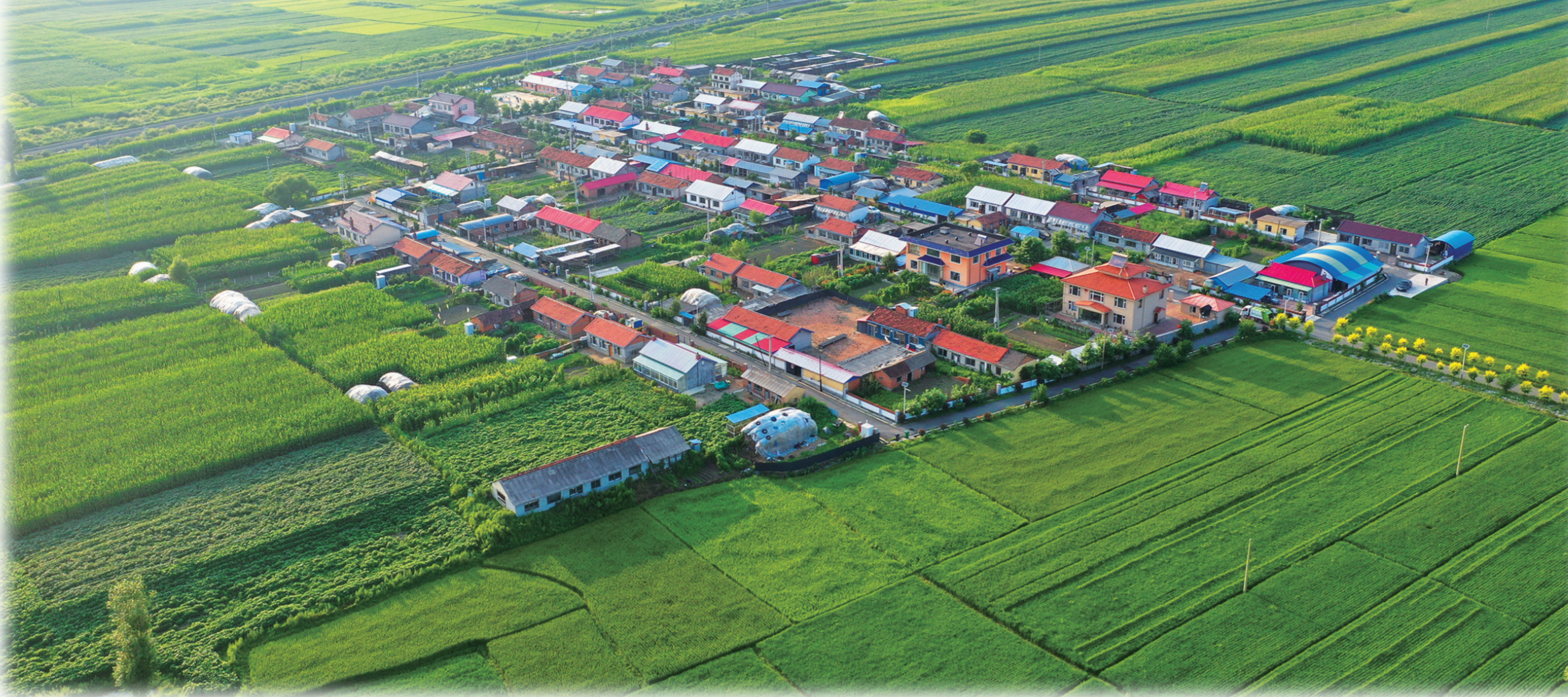
吉林市净美村庄建设取得阶段性成果。