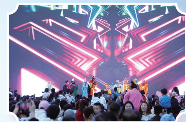
长春市动植物公园夜游出现场。