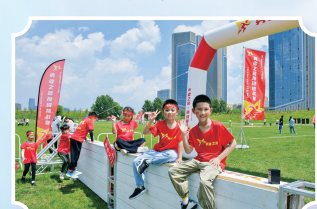
青怡坊云琅活动现场。

带了各种美食，在帐篷里一躺，特别舒坦。青山绿水之间，远离城市喧嚣。位于莲花山生态旅游度假区的浅山星空露营地不仅有不同种类的露营地，端午节假期首日还推出了五彩纳福、彩蛋迎福、采艾草、野餐美食会、嗨玩嗨嗨嗨、五彩泡泡秀等活动，趣味十足。露营的游客称，这里能烧烤、能做饭，还有孩子参与的游戏项目等。