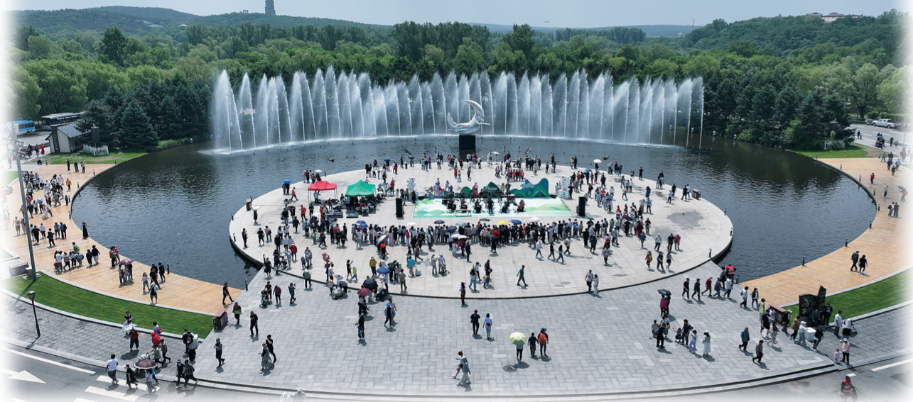
净月潭国家级风景名胜区内，精彩的交响乐演出引人驻足观看。

热火朝天，热闹非凡，热情洋溢，是这个端午假期长春的真实写照。迎八方来客，纳四海宾朋。长春用实际行动书写“长春，就是长春。”