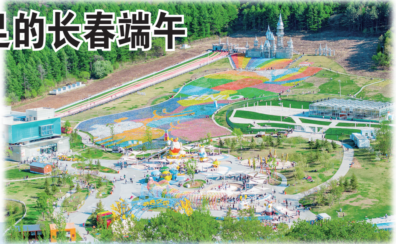
神鹿峰旅游度假区。

约三五朋友，在林中、在水边，支一顶帐篷，品户外美食，别具一番风味。这个端午假期，悠闲自在的露营也受到许多市民欢迎。据不完全统计，端午假期3天，长春170余家露营地共接待露营游客16.3万人次。