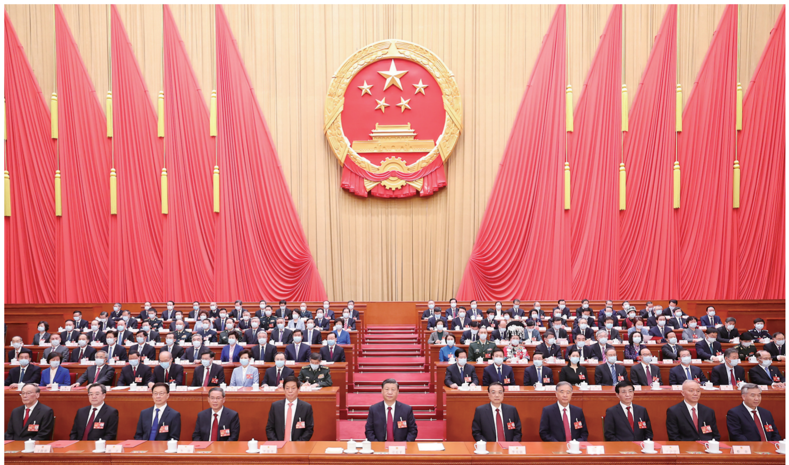
3月13日,第十四届全国人民代表大会第一次会议在北京人民大会堂闭幕。中共中央总书记、国家主席、中央军委主席习近平发表重要讲话。