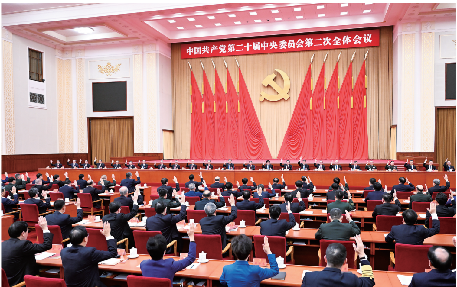
中国共产党第二十届中央委员会第二次全体会议,于2023年2月26日至28日在北京举行。中央委员会总书记习近平作重要讲话。