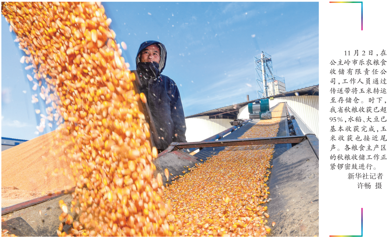
11月2日,在公主岭市乐农粮食收储有限责任公司,工作人员通过传送带将玉米转运至存储仓。时下,我省秋粮收获已超95%,水稻、大豆已基本收获完成,玉米收获也接近尾声。各粮食主产区的秋粮收储工作正紧锣密鼓进行。

创产品,做到以文促旅、以旅彰文。壮大县域经济是吉林振兴实现新突破的重要支撑。在吉林迎新玻璃有限公司,韩俊深入车间了解企业生产经营情况,他强调,要发挥本地资源优势,加快重点项目谋划建设,进一步扩大产能,优化产品结构,向多元化高端化发展。在双辽昊华化工有限公司,韩俊强调,要做优基础化工,延长产业链,提高市场竞争力。在国能双辽发电有限公司,韩俊了解到煤炭储备能够满足需求后十分放心。他强调,要进一步精准科学调度,统筹机组开机规模和发电计划,确保重点企业用电和居民温暖过冬。要科学统筹电网建设,提高清洁能源消纳能力。在吉林正轩车架有限公司,韩俊鼓励企业紧盯汽车产业“新四化”发展机遇,加大创新力度,积极参与重点项目配套。在调研中,韩俊要求,要在培育更多“专精特新”和“小巨人”企业上下更大功夫。要加强安全生产工作,确保安全生产责任落实到每一个环节、岗位、点位,牢牢守住安全生产底线。安桂武参加调研。