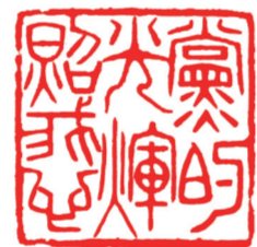
党的光辉照我心 杨文军作

都很漂亮。大约行驶了20分钟，车就开进了香水泉屯：笔直的柏油路横贯小屯东西，交错着几条南北向的街路。路基下是红砖垒砌的一米深的排水沟，沿路两排，栽植着绿色的松树，挺立着银柱的路灯。路两侧还有白色矮栅栏围成的花园。花园都统一标准尺寸，直抵街路两侧的农家院墙。院墙一米半高，墙顶带着暖沿，古朴、端庄。院墙上，还画有各式各样的农民画。