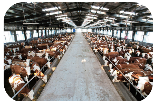
“慢牛快走”，畜牧业蒸蒸日上。

2016年12月，白城市生态环境保护委员会成立，由市委书记、市长共同担任委员会主任，并明确各级各部门的生态环境保护工作职责，建立起“管发展必须管环保、管生产必须管环保”的生态环境保护工作责任体系，推动经济社会发展全面绿色转型。