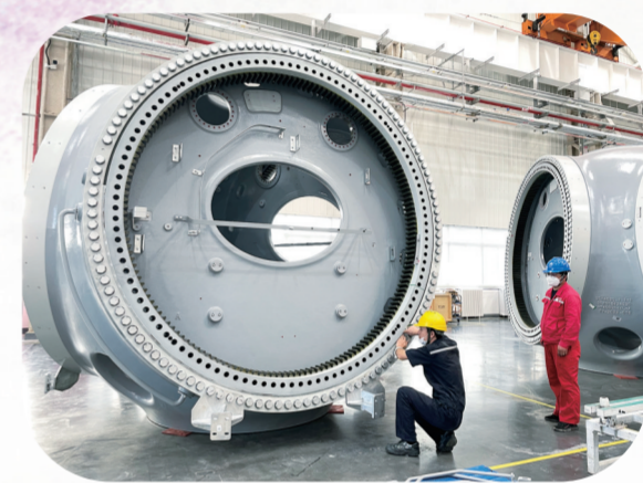
风电装备产业实现域内“一站式”采购。

依托良好的生态资源禀赋，大力发展绿色特色产业，突出主粮加工、肉乳制品加工、杂粮杂豆加工“三条