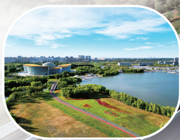
“海绵城市”建设，彰显生态魅力。

走进白城市洮北区人力资源市场，招聘大厅里人头攒动。环顾各企业的招聘席位，发现新能源装备制造、农产品深加工企业备受青睐，上前咨询的求职者特别多。