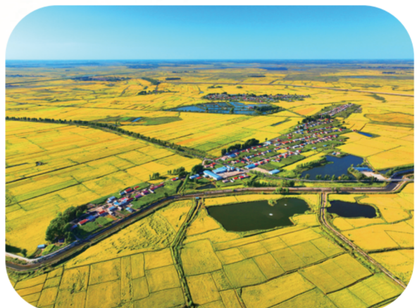
“水至粮丰”，粮食生产连年增收。

线”，聚焦壮龙头、强主体、建基地、创品牌，全力打造玉米、水稻、杂粮杂豆、肉牛、乳品、肉羊、生猪、禽类、水产、果蔬等农业“十大产业集群”，推动形成具有地方特色的农业产业化发展之路。