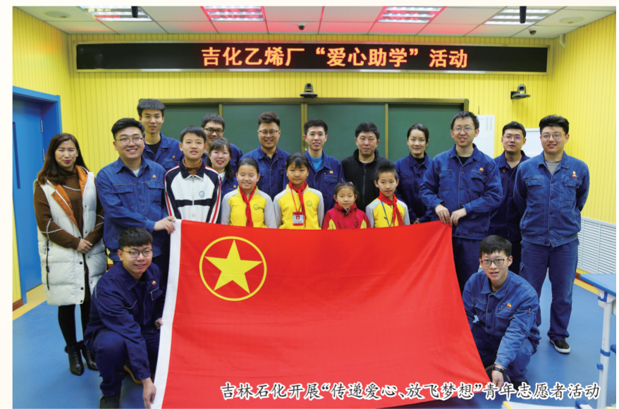
吉化乙烯厂“爱心助学”活动