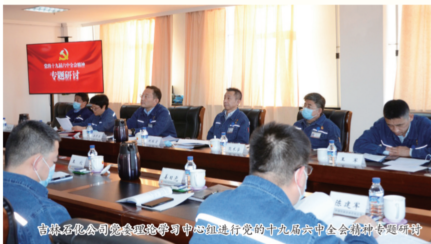
吉林石化公司党委理论学习中心组进行党的十九届六中全会精神专题研讨

吉林石化牢记“我们要建设强大的化学工业”的使命任务，把党和国家的理想追求转化为全体职工的理想信念，牢固树立政治意识、责任意识和报国理想，努力