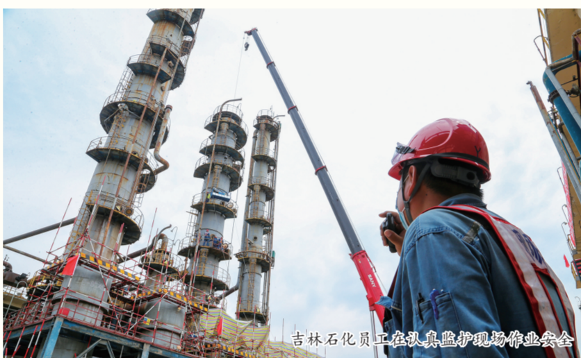
吉林石化员工在认真监护现场作业安全

吉林石化把“解忧工程”纳入“我为员工群众办实事”七大民心工程，加大精准帮扶力度，确保每一个困难家庭生活有保障、每一个困难人员看得起病、每一个困难家庭子女上得起学，全力以赴解除员工群众后顾之忧，维护企业大局和谐稳定。