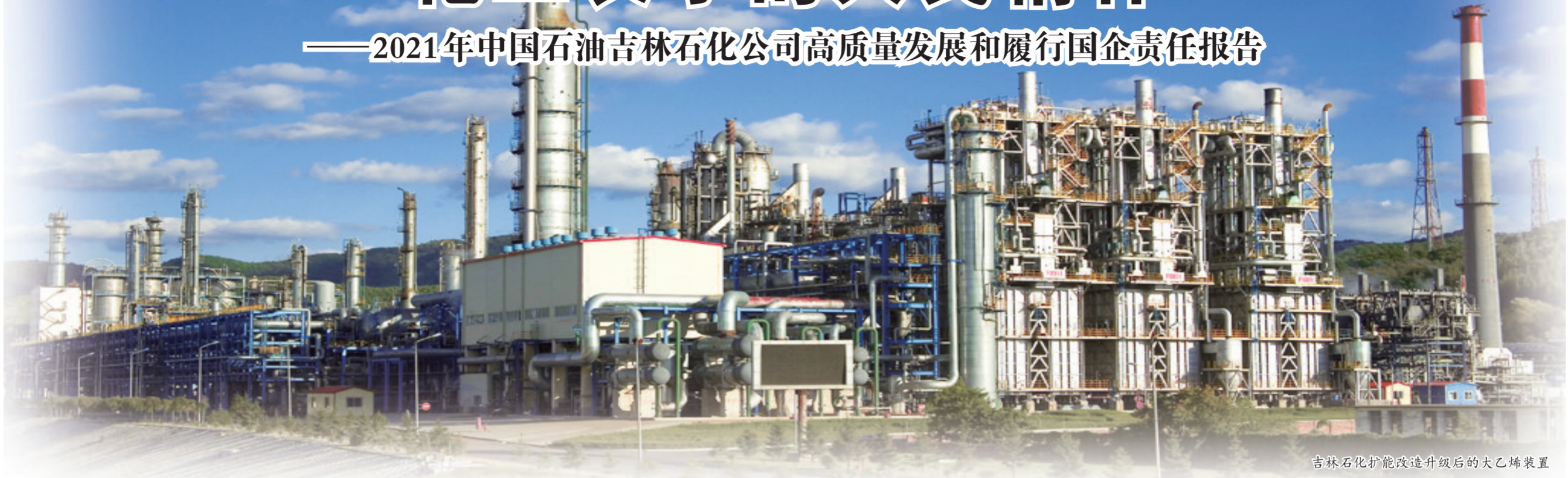
吉林石化扩能改造升级后的大乙烯装置

“刚刚过去的2021年，是吉化发展进程中极不容易的一年。一年来，我们共同经历了很多大事难事，付出了不少艰辛努力，也战胜了许多风险挑战，更收获了值得欣慰的成果和业绩，实现了‘十四五’的良好开局。”2022年1月20日，吉林石化公司党委书记、执行董事金彦江说。