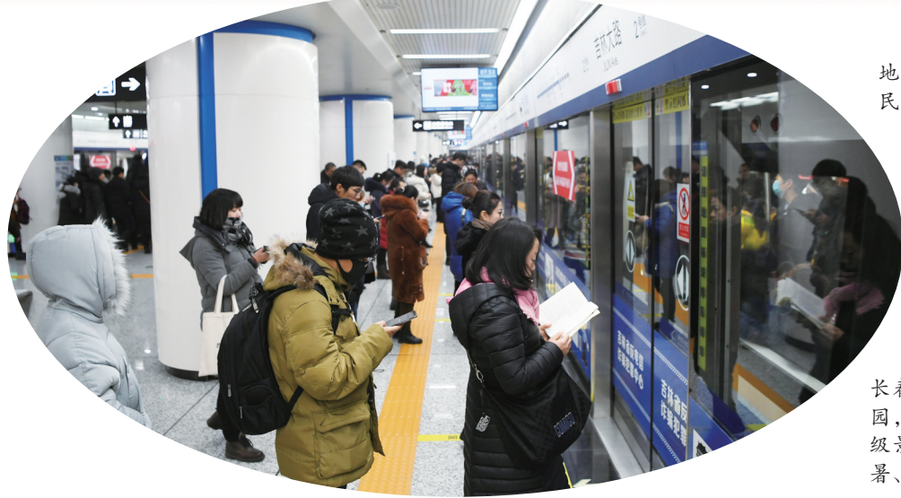
进入冬季，地铁客流量增加，市民文明出行。

以更高水平开放拓展发展空间。在深化“五个合作”中融入新格局，深度参与“一带一路”建设，主动对接京津冀协同发展、长江经济带发展、粤港澳大湾区建设等重大战略，做好产业承接，促进要素流动，在共享机遇中畅通经济循环。深化与天津、杭州对口合作，在资源共享、园区共建、产业集群建设等方面取得突破。加强与各市州对接合作，推动省域协同发展、共同发展。高水平建设长春新区、中韩示范区、兴隆综保区、临空经济示范区，申建吉林自贸区长春片区，办好电影节、汽博会、农博会等品牌赛事，进一步提升城市开放度。推进辽吉通集高铁等通道建设，加快推进龙嘉机场二期，拓展国际国内航线，扩大长满欧、长欧欧、长春至汉堡中欧班列和长春至天津、大连海铁联运运营规模，增强链接全球能力。